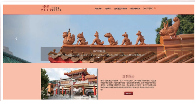
❖ 香港全真道堂科儀音樂電子資料庫首頁。

「全真道堂科儀音樂」是同時涉及儀式動作、音樂唱誦、文字傳承等不同文化範疇的非物質文化遺產。本資料庫通過豐富的文字描述、圖片說明、影片攝錄及樂譜來保存「全真道堂科儀音樂」的歷史與面貌，讓公眾能夠透過此平台認識這項傳統的宗教文化。