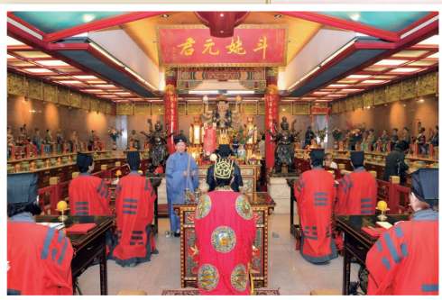
蓬瀛仙館經生施演《清微禮斗科》。

科儀主要朝禮斗姥元君及北斗七元星君以求增福延壽。因北斗掌管世人死籍，故道教認為人欲解厄延壽，必要朝拜北斗，以祈黑簿除名，青冊延生。