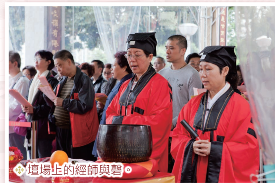
壇場上的經師與磬。

參與儀式的人員稱為「經生」，按照壇場內的分工可分為高功法師（主科）、都講法師（二手）、監齋法師（三手）、侍壇經生及散眾經生。香港的全真科儀音樂，一般以「經韻」音樂的「聲樂」為主體，按照朗讀和吟唱的方法，可分為「朗誦式」、「吟誦式」、「吟唱式」、「詠唱式」四種音樂形態。在唱誦時，主要由主科與二手起腔，決定腔調和速度；在一些儀式中，二手和三手分別敲擊木魚和磬，以控制經韻節奏。