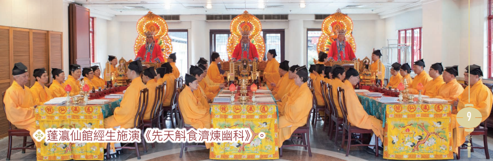
蓬瀛仙館經生施演《先天斛食濟煉幽科》。

香港全真道堂最大型的度亡科儀。儀式分為超幽、施食和煉度三大部分。經師會為亡靈施以法水法食及進行煉度，導引他們皈依大道，早日超脫沉淪，升登仙界。