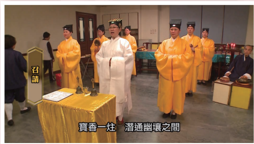
❖ 科儀音樂影片截圖。

資料庫會持續上載高質素的全真道堂科儀音樂影片供大眾瀏覽。影片採用實錄拍攝的形式，並以儀式為分類單元，全面記錄香港全真