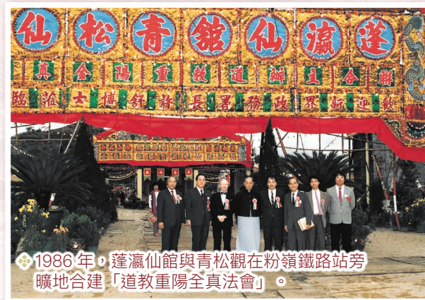
1986 年，蓬瀛仙館與青松觀在粉嶺鐵路站旁曠地合建「道教重陽全真法會」。

道教儀式具備了靜態和動態元素，前者包括壇場佈置、法冠服飾、科書文檢等；後者則指法事中道士的「唱」、「唸」、「做」。在「唱」、「唸」的部分，道士會以特定的節奏和腔調朗讀或吟唱經文，有時更伴以樂器演奏。這些在道教儀式中使用的「聲樂」和「器樂」，道教中人泛稱「經韻」，而道外人士則稱之為「道教音樂」。