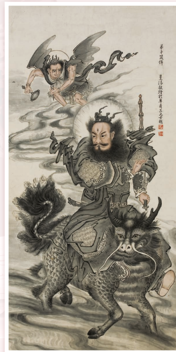
❖ 蓬瀛仙館藏民國十九年(1930年)三元宮弟子繪九天應元雷聲普化天尊聖像。

有關「全真道堂科儀音樂」的活動消息將會在資料庫上作出報導，帶領大眾瞭解香港道堂科儀的發展與最新動向。